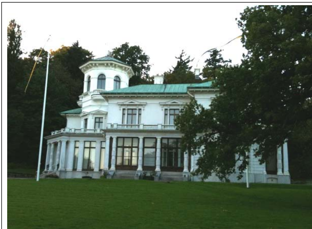
Överås i kvällsljus

Nu "bor" minna på Överås tillsammans med bl a Metodistkyrkan, Cateringfirman VR Deli, Studieförbundet Bilda, Burgårdens gymnasium och Kvinnofridscentrum ( som arbetar med att ordna skyddat boende för kvinnor, som lever under hedersrelaterat