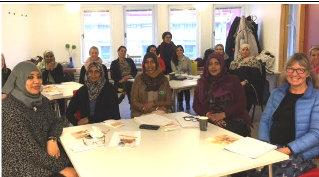
Utbildningsdag 20/11 för kvinnor från Somalia, Eritrea och Iran.